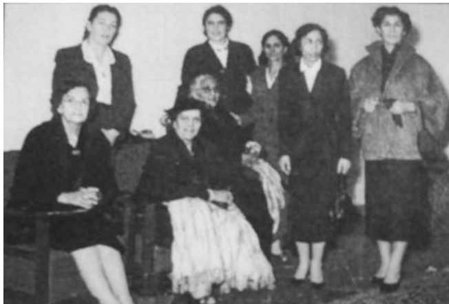
نهجومهتی ژنان له پاش شورشي مشروده

له بواری ریخوستندا پاش قوناعی پاشایهتی مههمهده عملی شای فاجار، ریگا کراوه بو دروست بوونی حیزب. نهوش ریی خوش کرد همتا داواکاریهکاني کومهلگا بیتهسهر زمان له سیاستی روژانهدا. هاوکات ریگا کراوه بو نهوهی ژنانیش به شیویهکی فهرمی بتوانن له نيو